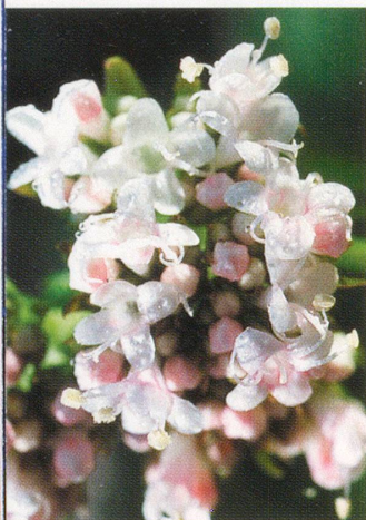
Pflanzen, die beim Schlafen helfen: Baldrian ( Valeriana officinalis , oben) sowie Melisse ( Melissa officinalis , Mitte) und Passionsblume ( Passiflora incarnata , unten).