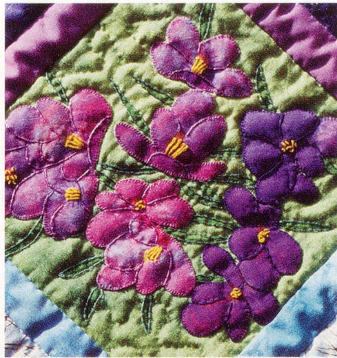
Motive aus dem «GN-Blumen-Quilt».