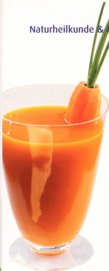
Frischer Karottensaft und rohe Karotten sind unentbehrliche Bestandteile jeder leberschonenden Diät.

Ob frisch oder tiefgekühlt, ob als Saft oder Müeslizutat, rohe, ungesüßte Heidelbeeren haben eine gute Wirkung auf Leber und Galle.