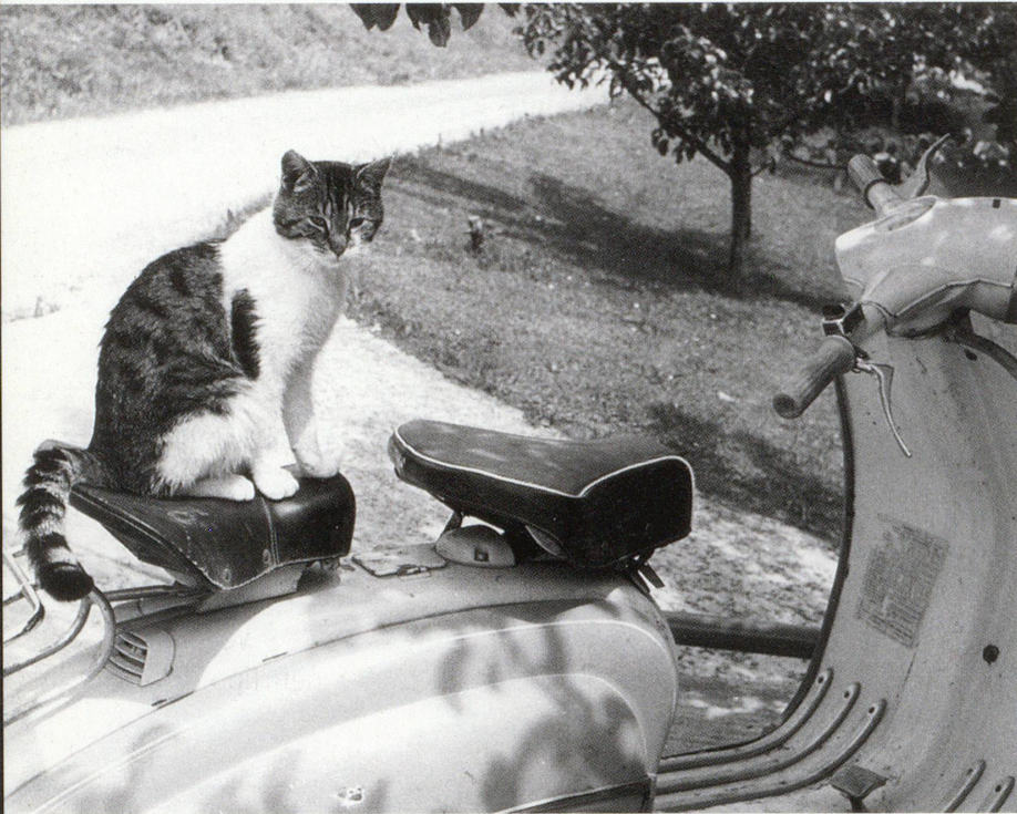
Leserforum-Galerie «Haustiere»: Schöne Katze auf schickem Gefährt!