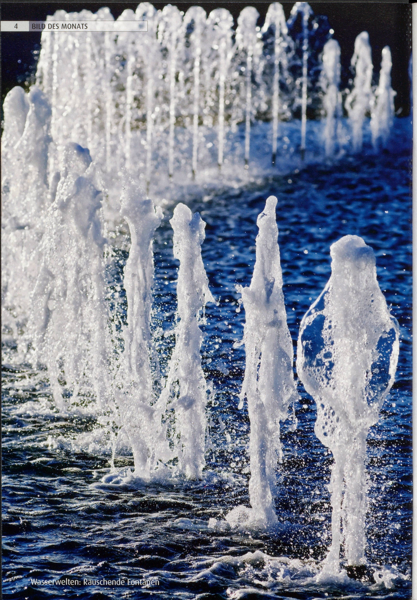
Wasserwelten: Rauschende Fontänen