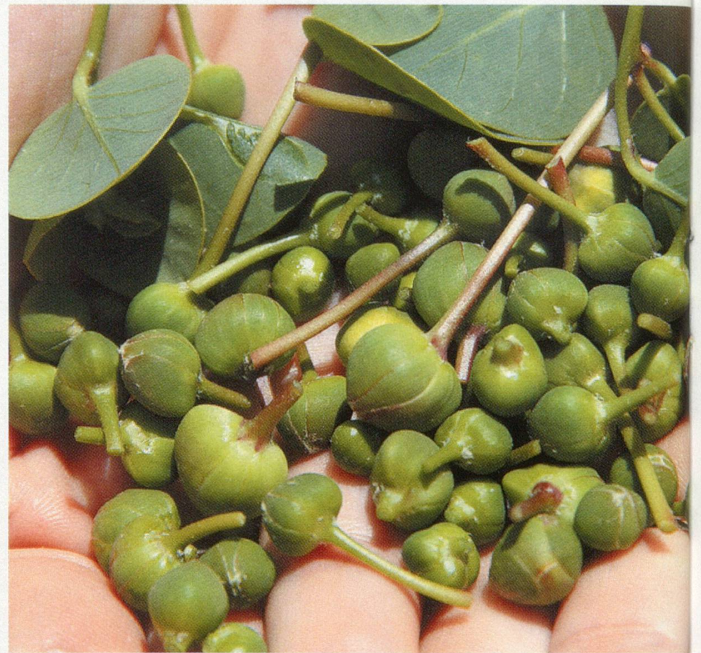
Frisch gepflückte Kapern werden auf Salina in Salz eingelegt.