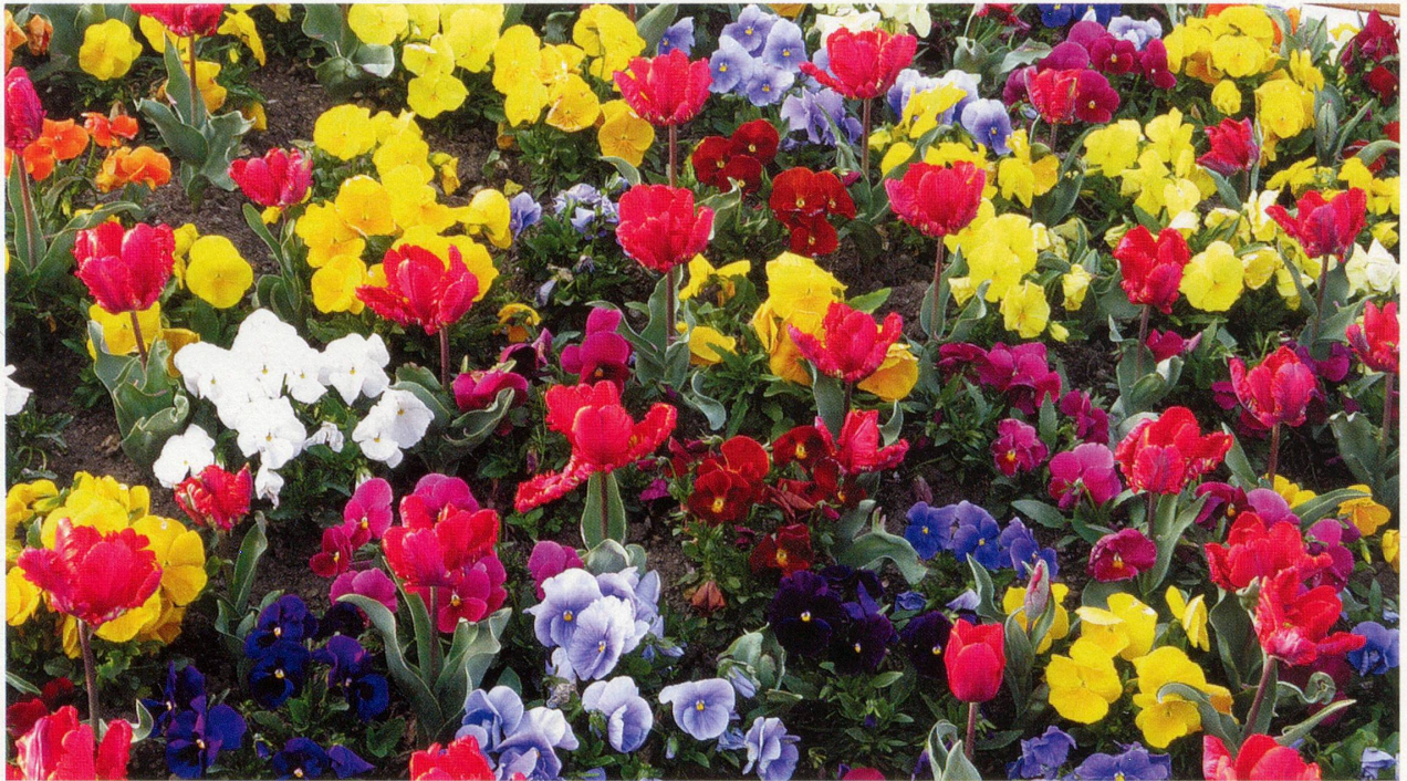
Diese ganze Blütenpracht dient nur als Werbemassnahme, um Insekten zur Bestäubung zu gewinnen.

Blütenstaub oder Pollen, was lateinisch Mehlstaub heisst, ist eine mehlartige Masse, die in den Staubbeutel der Samenpflanzen gebildet wird und aus einzelnen Pollenkörnern, den Mikrosporen, besteht. Vor Regen geschützt werden sie durch kugelige oder glockige Hüllen, die wie Schirme die Wassertropfen an ihren Aussenwänden abgleiten lassen.