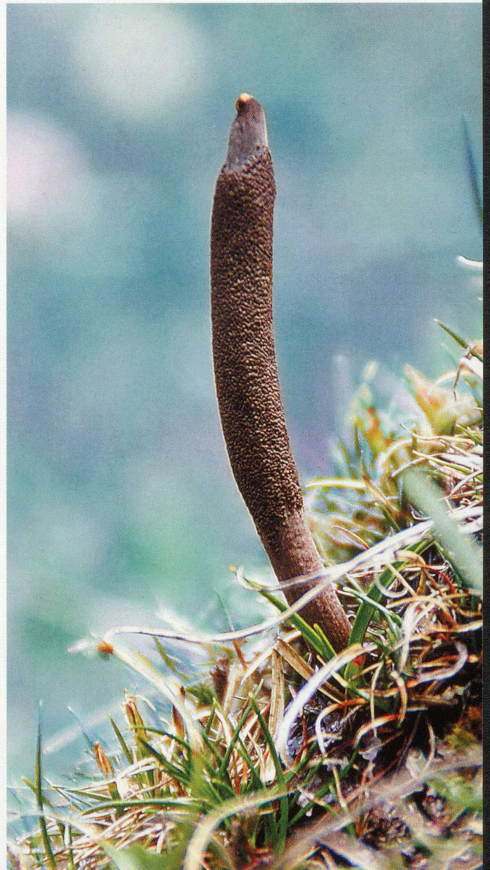
Der Tibetische oder Chinesische Raupenpilz wächst im Himalaya in etwa 3000 bis 5000 Meter Höhe.

Schmetterlingsweibchen der Gattung Thitarodes , die ebenfalls nur in Tibet vorkommt, Wurzelbohrer oder Geistermotten genannt, legen zahlreiche Eier auf den Bergwiesen ab. Die daraus schlüpfenden Raupen bohren sich in den Boden und fressen an Pflanzenwurzeln. Die Sporen des parasitischen Pilzes befallen die Larven, und das Pilzgeflecht ernährt sich von ihrem Gewebe, bis der gesamte Körper der Raupe von seinen feinen Fäden ausgefüllt ist.