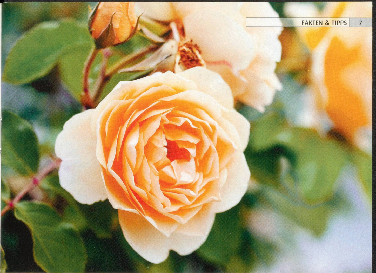
Die Damaszener-Rose: «Königin der Blumen» (Sappho)