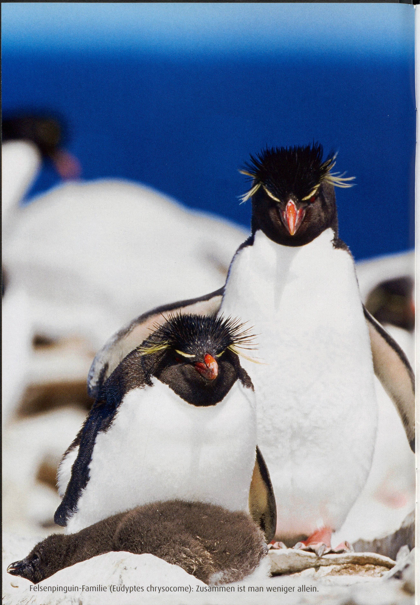
Felsenpinguin-Familie ( Eudyptes chrysocome ): Zusammen ist man weniger allein.