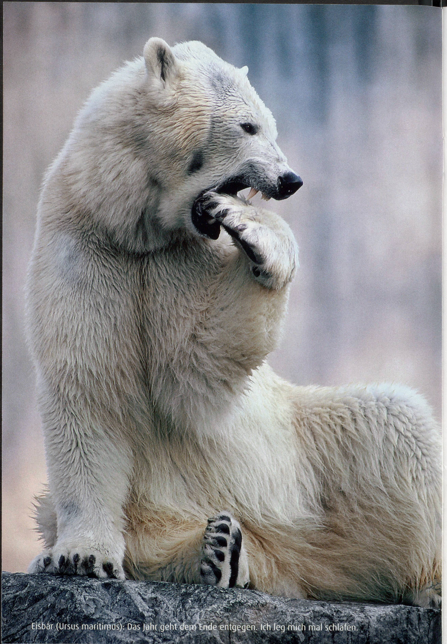
Eisbär ( Ursus maritimus ): Das Jahr geht dem Ende entgegen. Ich leg mich mal schlafen.