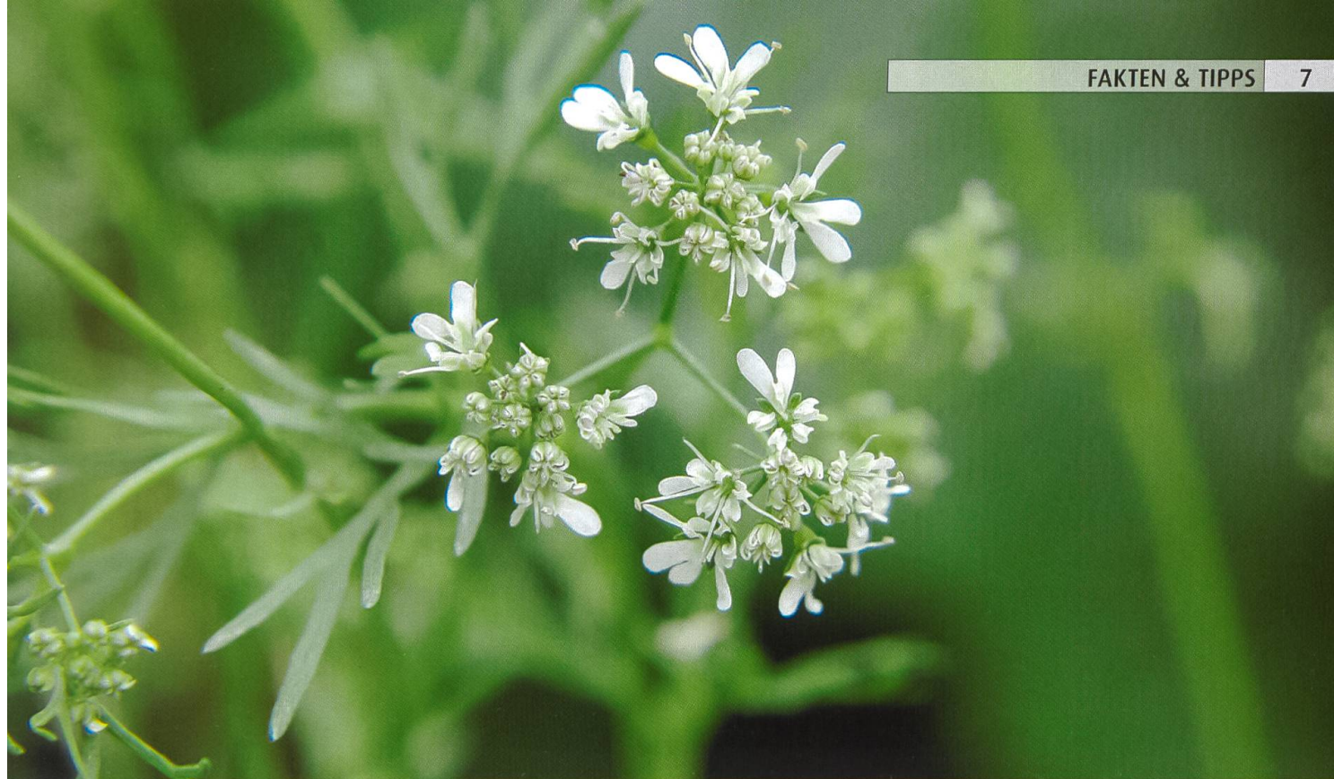
Anis blüht von Juni bis September.