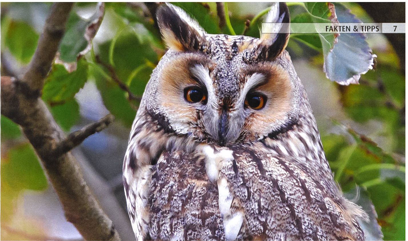
Waldohreule: Verbirgt sich tagsüber gern in Bäumen.