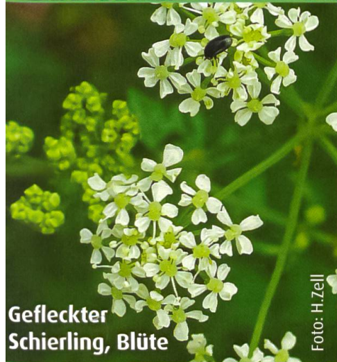
Gefleckter Schierling, Blüte