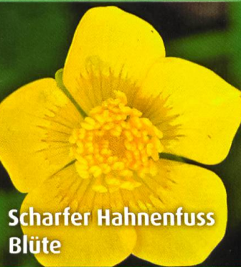
Scharfer Hahnenfuss Blüte