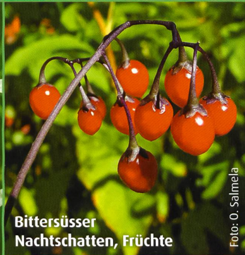
Bittersüßer Nachtschatten, Früchte