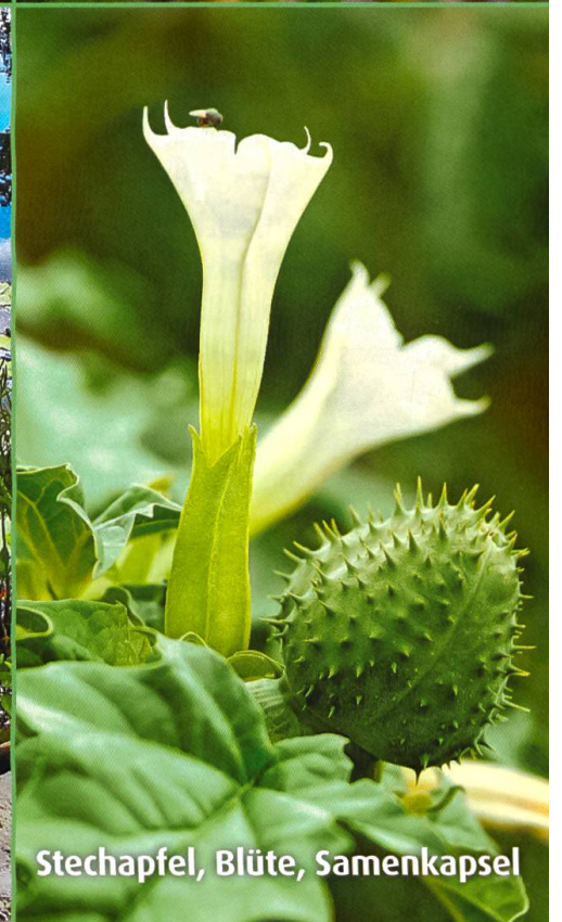
Stechapfel, Blüte, Samenkapsel