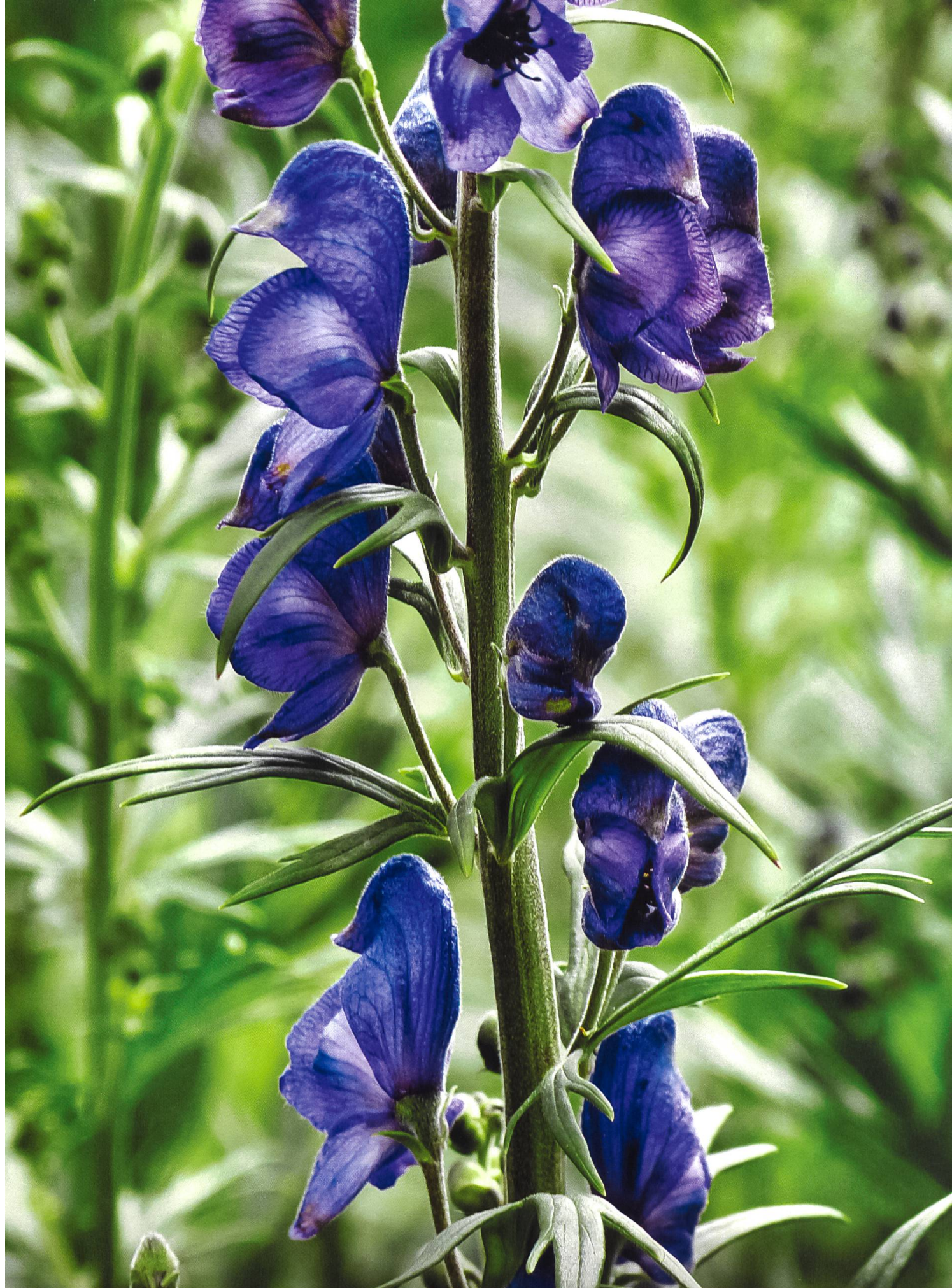
Gefährliche Schönheiten: Der Blaue Eisenhut ( Aconitum napellus ) ist eine der giftigsten Pflanzen Europas. Aconitin ist ein Herz- und Nervengift, das schon im Milligrammbereich tödlich wirkt. Bereits das Berühren der Pflanze hat unangenehme Folgen.