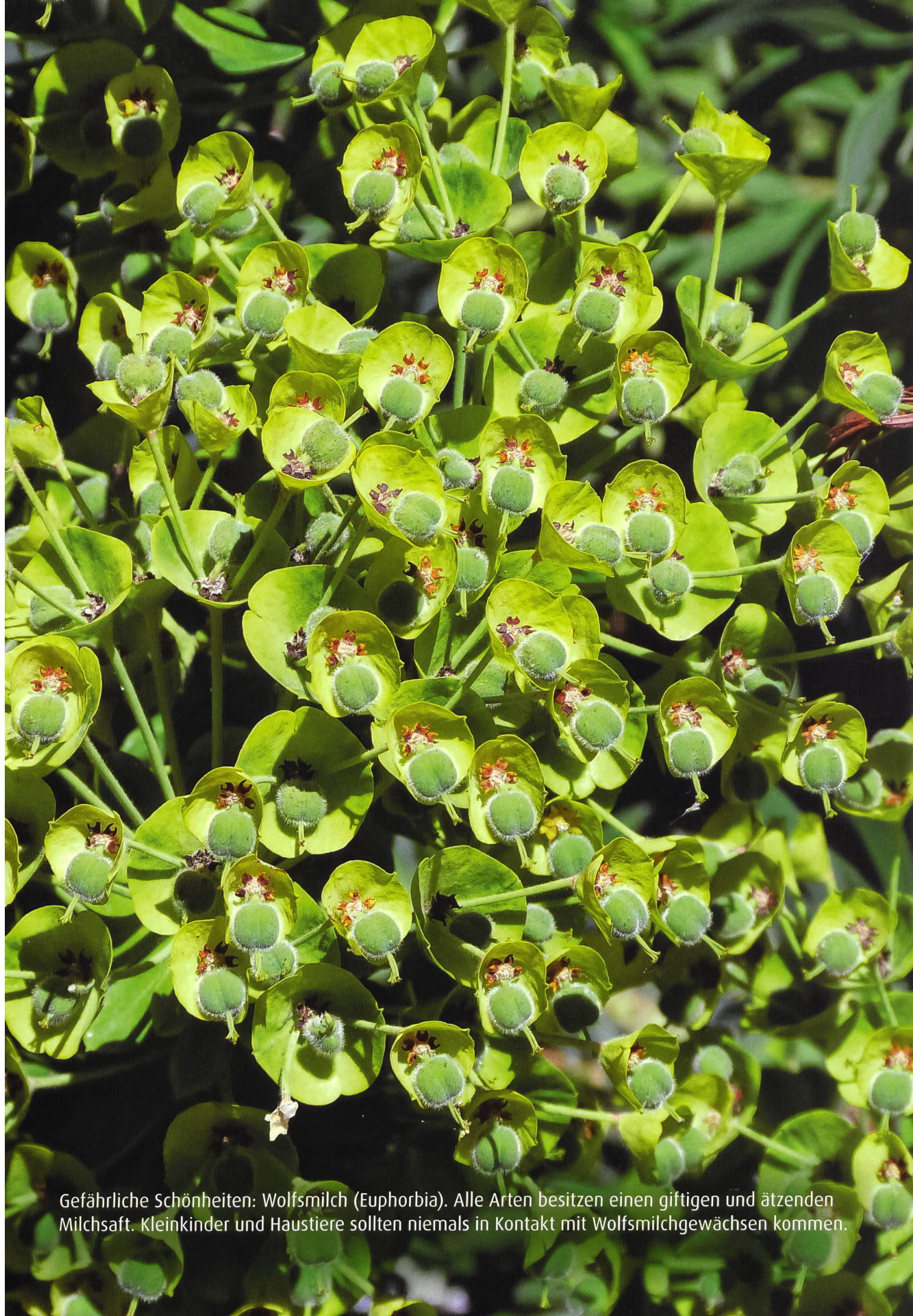
Gefährliche Schönheiten: Wolfsmilch (Euphorbia). Alle Arten besitzen einen giftigen und ätzenden Milchsafte. Kleinkinder und Haustiere sollten niemals in Kontakt mit Wolfsmilchgewächsen kommen.