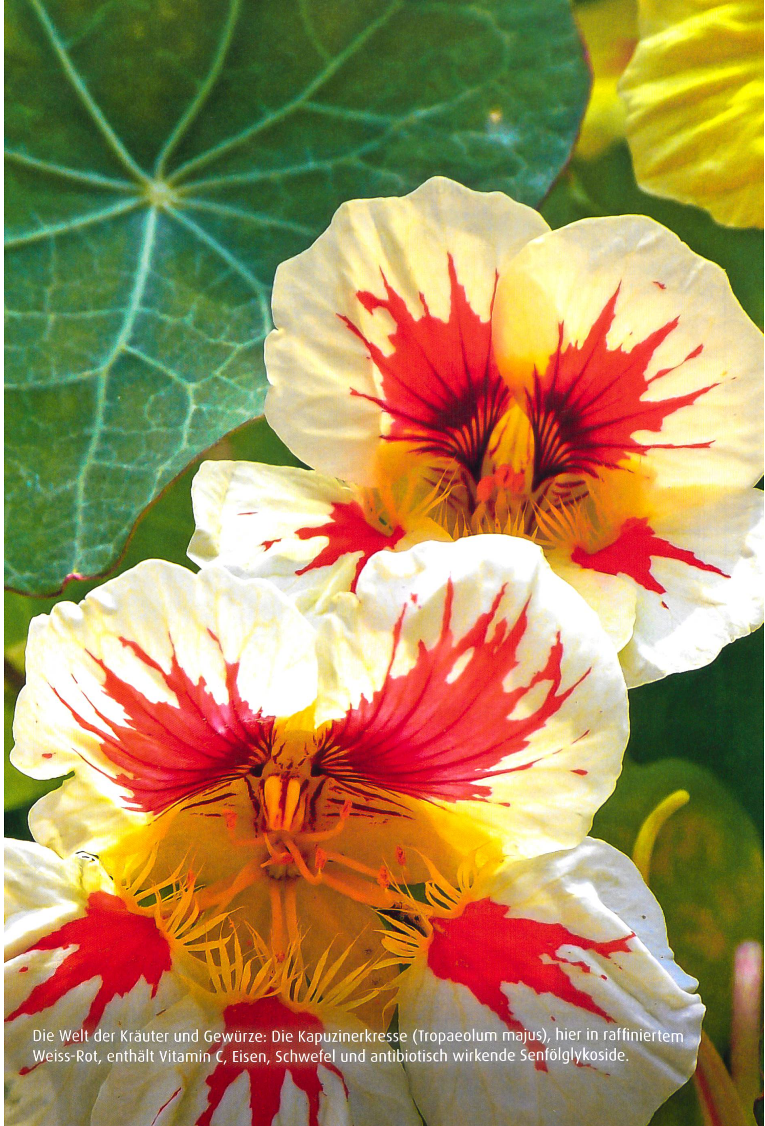
Die Welt der Kräuter und Gewürze: Die Kapuzinerkresse ( Tropaeolum majus ), hier in raffiniertem Weiss-Rot, enthält Vitamin C, Eisen, Schwefel und antibiotisch wirkende Senfölglykoside.