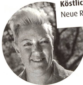
Köstlich zum Nachkochen Neue Rezepte von Vreni Giger