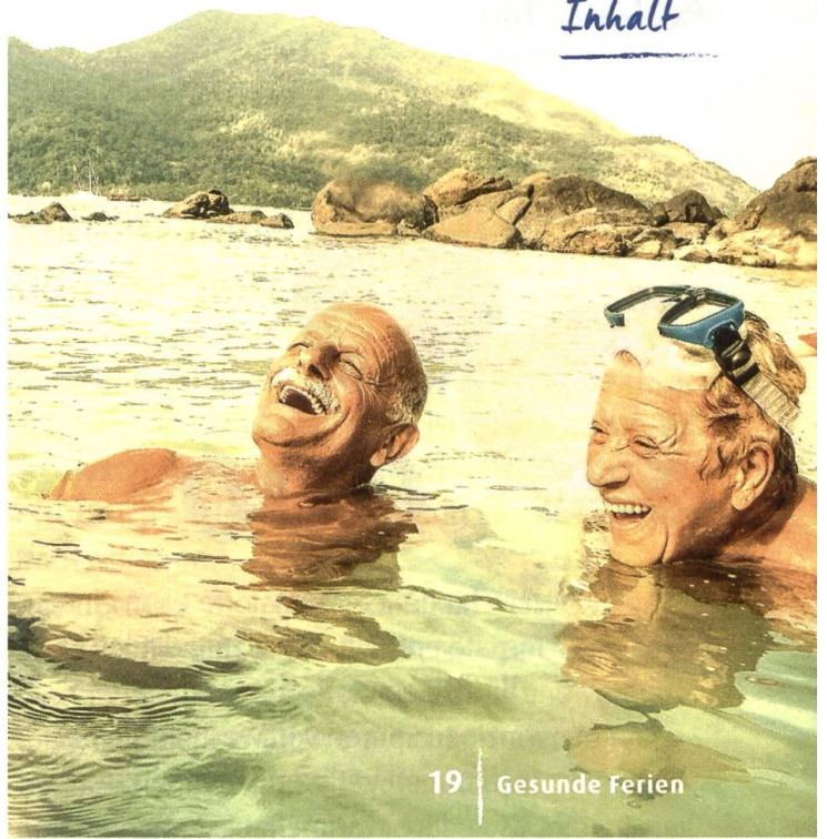
19 | Gesunde Ferien