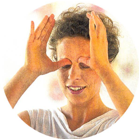
Akupressur im inneren Augenwinkel, regt den Energiefluss und die Durchblutung an, wirkt positiv aufs Sehen.

Oberlippenfältchen entstehen schnell, wenn man den Mund zu oft kräuselt. Bei Übungen gegen diese Fältchen geht es darum, die Haut von innen aufzupolstern und den Mundringmuskel so zu kräftigen, dass keine neuen Fältchen entstehen. Legen Sie einen Zeigefinger unter das Kinn, den anderen auf den unteren Teil der Oberlippe. Öffnen Sie den Unterkiefer ein wenig gegen den Widerstand des unteren