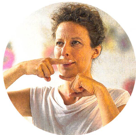
Kräftigung des Mundringmuskels, strafft den Kinnboden und glättet Oberlippenfältchen.