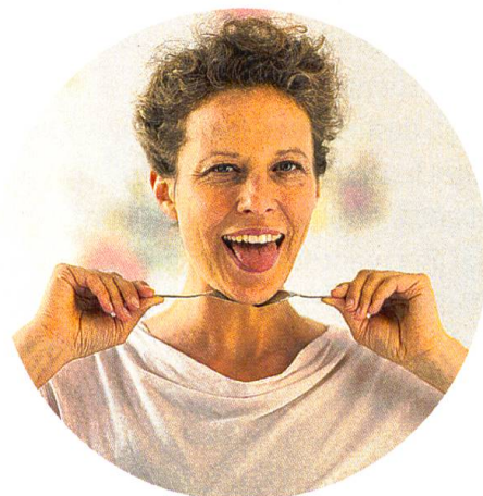
Zwei kalte Löffel und ein fröhlicher Zungeneinsatz, ideal gegen das Doppelkinn.