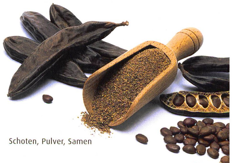
Schoten, Pulver, Samen

Doch wie kann man am beschriebenen Carobgenuss teilhaben? Die Pflanze ist schliesslich in den Alpenländern nicht beheimatet und generell nicht sehr bekannt. Das meistangebotene Produkt ist Carobpulver, erhältlich in vielen Reformhäusern und Naturkostläden, oft im Regal neben Kakaoprodukten. Das Pulver kann wie Kakao roh als Beigabe für Getränke, Aufstriche und Rohkost-Desserts sowie als Backzutat für Kuchen, Plätzchen und Crêpes verwendet werden. Generell kann man in jedem Rezept Kakaopulver durch Carobpulver ersetzen, wobei zu beachten wäre, dass Carob süsser als Kakao ist und man deswegen weniger Zucker oder Zuckeralternativen benötigt. Der Geschmack von Carob ist milder als Kakao und kommt in Kombination mit Gewürzen wie z.B. Zimt, Vanille, Ingwer und Kardamom am besten zur Geltung. Für diejenigen, die an weiteren Carobprodukten interessiert sind, lohnt es sich, online zu suchen. Aus den Hauptanbauländern Spanien, Italien, Portugal, Griechenland, Zypern, Malta und der Türkei sind die ganzen Früchte sowie daraus hergestellte Produkte und lokale Spezialitäten erhältlich. Sie alle können unserem Speiseplan eine neue Würznote geben (siehe auch Rezept nächste Seite).