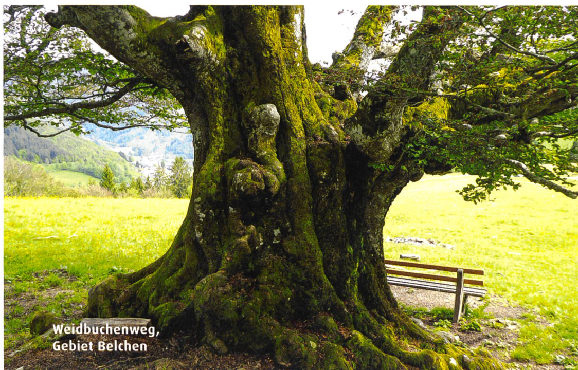
Weidbuchenweg, Gebiet Belchen