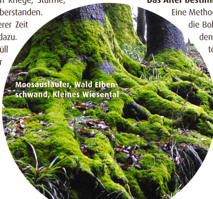
Moosausläufer, Wald Elbenschwand, Kleines Wiesental

Eine Methode zur Altersbestimmung ist die Bohrkernentnahme. So wird in den Stamm mittels einer Lanzette ein kleines Loch gestanzt. Die Jahresringe werden dann abgelesen. Bei gefällten Bäumen werden die Jahresringe abgezählt. Sie geben sogar Auskunft über die fetten und mageren Jahre, die ein Baum durchlebt hat.