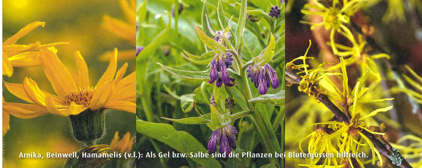
Arnika, Beinwell, Hamamelis (v.l.): Als Gel bzw. Salbe sind die Pflanzen bei Blutergüssen hilfreich.

Vielleicht gehören Sie aber auch zu den Menschen, die eine Veranlagung zu blauen Flecken haben. Ein Hämatom entsteht schon durchs Anfassen am Arm oder leichtes Anstossen. Der Grund dafür: Die Umhüllung der Kapillaren, also der kleinsten und feinsten Blutgefäße, ist verletzlicher als bei anderen. Frauen sind davon deutlich häufiger betroffen als Männer.