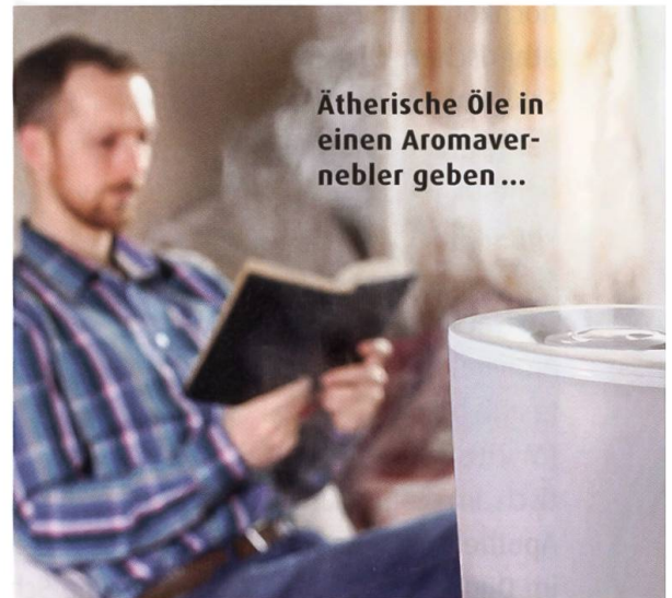
Ätherische Öle in einen Aromavernebler geben...

Möglichkeit 3: Die innerliche Einnahme von ätherischen Ölen – ein heikles Thema. Ätherische Öle sind