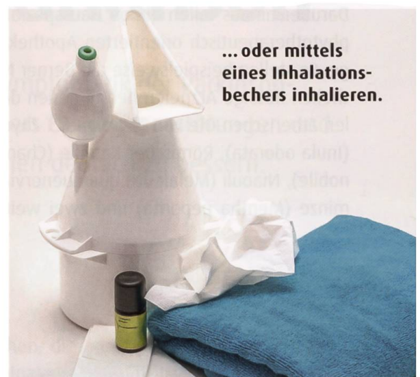
... oder mittels eines Inhalationsbeckers inhalieren.