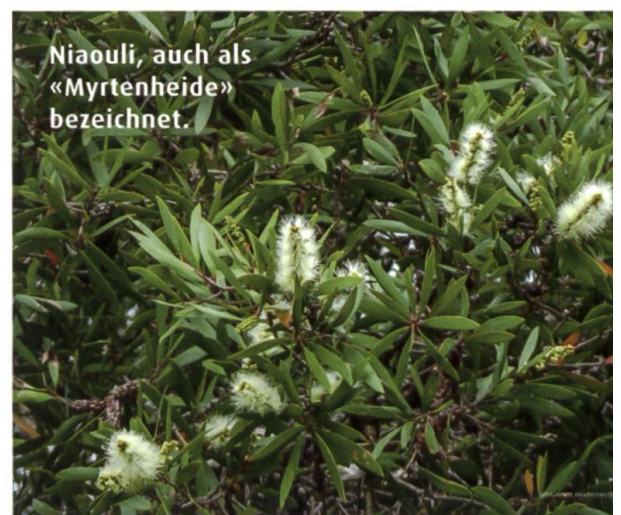
Niaouli, auch als «Myrtenheide» bezeichnet.