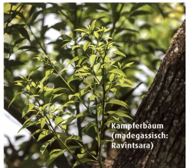
Kampferbaum (madegassisch: Ravintsara)