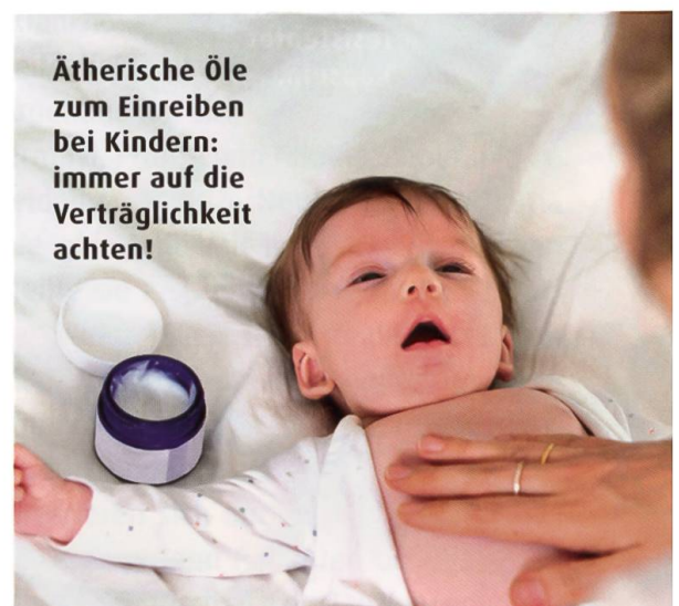
Ätherische Öle zum Einreiben bei Kindern: immer auf die Verträglichkeit achten!