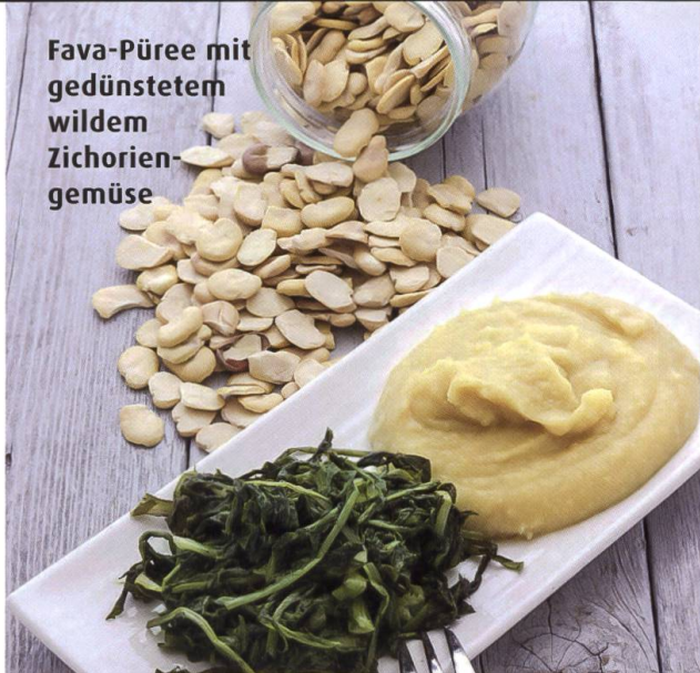
Fava-Püree mit gedünstetem wildem Zichorien-gemüse