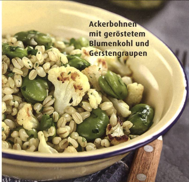
Ackerbohnen mit geröstetem Blumenkohl und Gerstengraupen