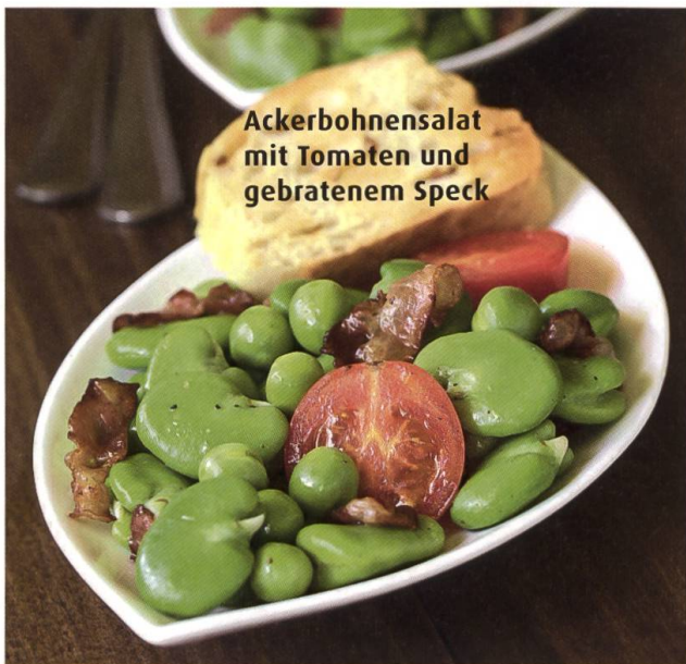
Ackerbohnen Salat mit Tomaten und gebratenem Speck