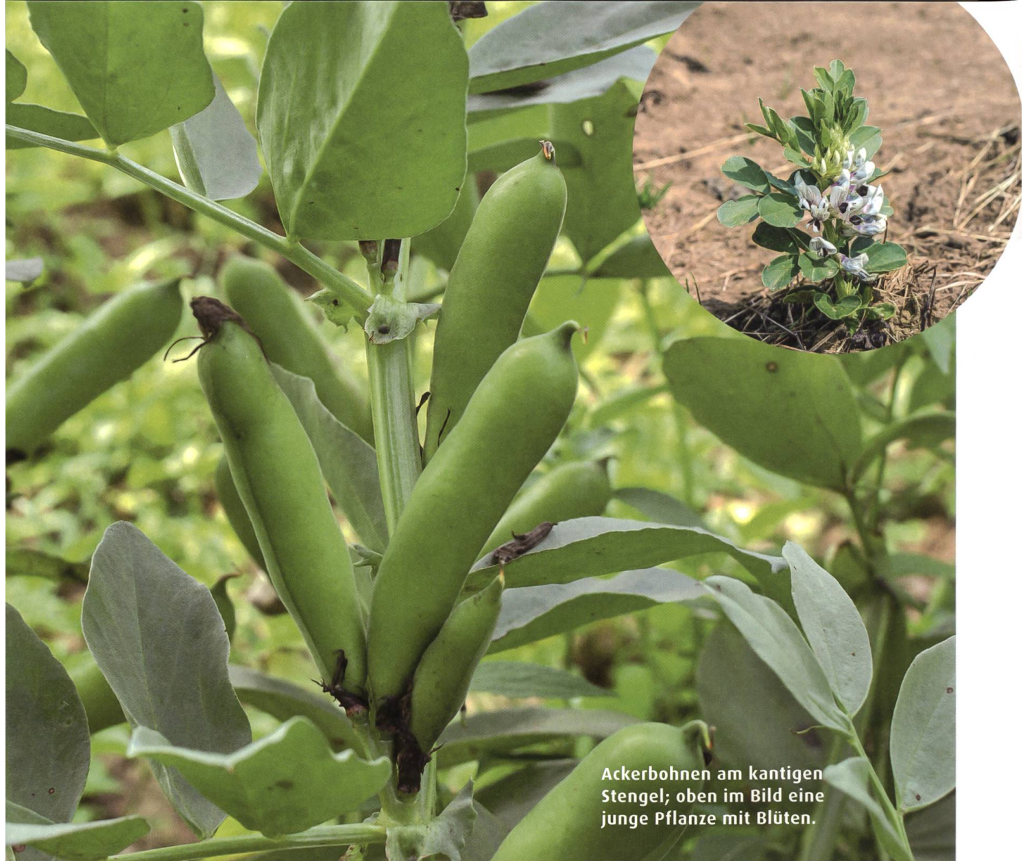
Ackerbohnen am kantigen Stengel; oben im Bild eine junge Pflanze mit Blüten.

über kaufen. Erhältlich sind auch tiefgekühlte und in Gläsern eingemachte Favabohnen, aber wie bei fast jedem Gemüse gilt auch hier: Frisch schmeckt es am besten. Bei konservierter Ware muss das Häutchen notgedrungen mitverwendet oder bei Tiefkühlware von den eiskalten Bohnen gepult werden. Wenn Sie Dicke Bohnen im Sommer frisch kaufen, brauchen Sie für zwei Portionen ein Kilo mit Schoten. Achten Sie beim Kauf auf unversehrte, knackig-pralle Schoten. Aufbewahren können Sie Dicke Bohnen im Kühlschrank einige Tage lang. Sie sollten die Samen aber unbedingt in der Schale lassen. Die Kerne allein verderben innerhalb eines Tages.