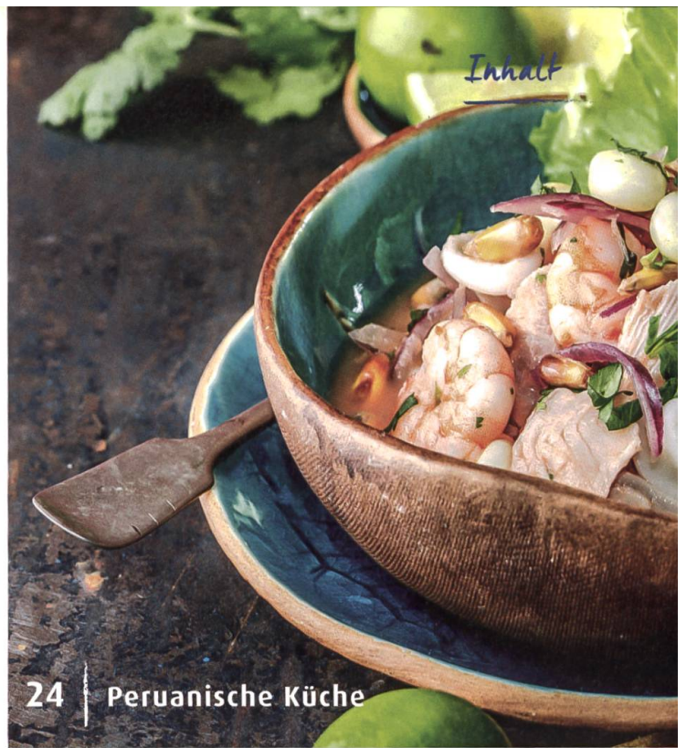
24 | Peruanische Küche