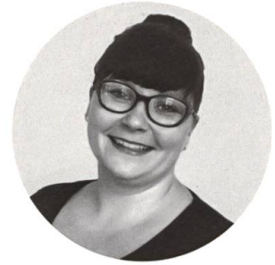
Assata Walter Gesunde Küche mit Biss.