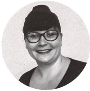
Assata Walter Gesunde Küche mit Biss.

Weitere vegane und vegetarische Ideen: www.avogel.ch , Stichwort vegan