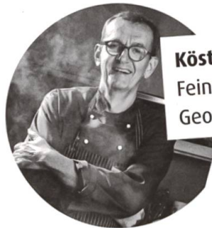
Köstlich zum Nachkochen: Feine Rezepte von Georg Reuter