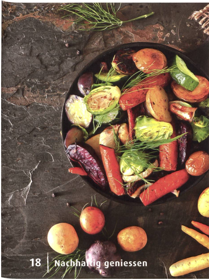
18 Nachhaltig genießen