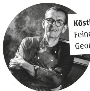
Köstlich zum Nachkochen: Feine Rezepte von Georg Reuter