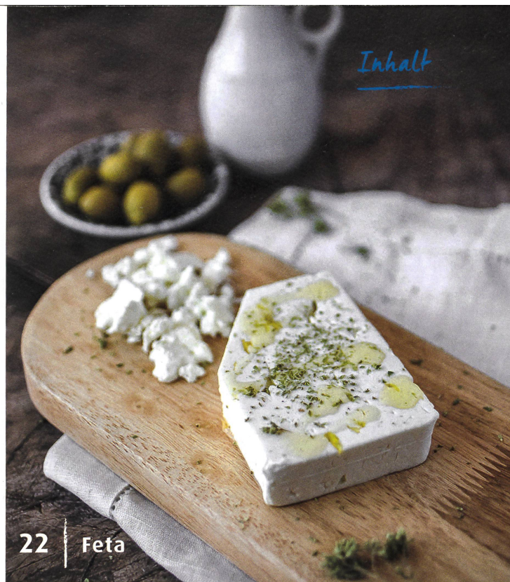
22 | Feta