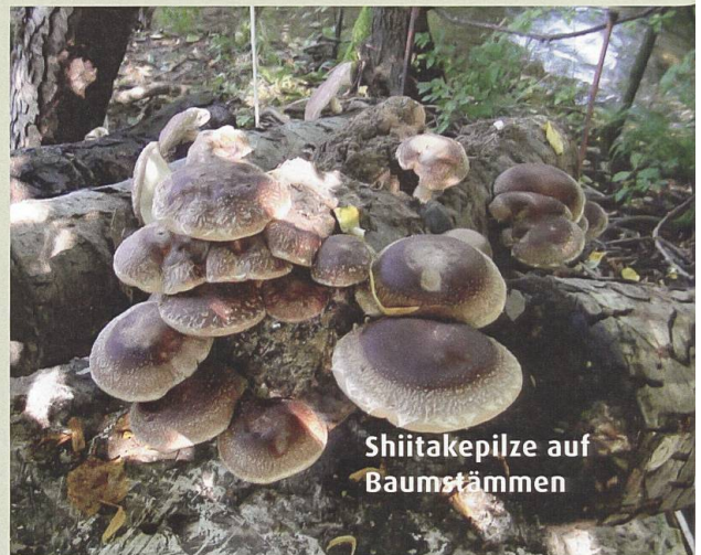
Shiitakepilze auf Baumstämmen