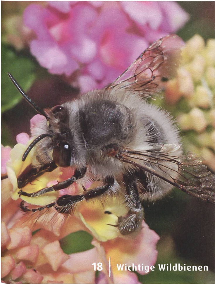
18 | Wichtige Wildbienen