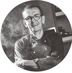
Georg Reuter Kreative Frischeküche mit Stil.