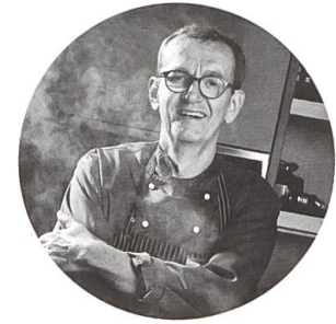
Georg Reuter Kreative Frischeküche mit Stil.