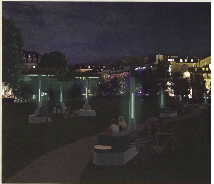
Vision einer Illumination des öffentlichen Raums im französischen Rambouillet, in Szene gesetzt vom Unternehmen «glowee».

lereien hinreißen lassen, z.B. mit Pilzlumineszenz leuchtenden Zierpflanzen, gentechnisch veränderten, leuchtenden Aquariumsfischen oder fluoreszierenden Kaninchen mit manipuliertem Erbgut, die unter Schwarzlicht grün im Dunkeln leuchteten. Einige Start-ups werben mit einer «lebendigen, autonomen Beleuchtungs-Ressource», wollen also Licht erzeugende Bakterien verpacken und als Lichtquelle nutzbar machen. Gibt es in der Zukunft folglich gratis Licht für alle? Davon ist man noch weit entfernt. Es kostet eine ungeheure Menge Energie, die spezifischen Eigenschaften für das Wachstum und Leuchten von Bakterien aufrechtzuerhalten. Im französischen Rambouillet machte sich ein Unternehmen daran, mit dem Gel von Millionen biolumineszierender, aus Meerestieren gewonnener Bakterien nachts einen ganzen Strassenzug zu beleuchten. Heheres Ziel hinter diesem Versuch: die urbane Landschaft der Zukunft neu zu gestalten – schöner, natürlicher und ohne umweltschädliche Lichtverschmutzung. Bis dato gelang allerdings nur eine Beleuchtung, die gerade mal drei Tage anhielt und die Lichtintensität einer Kerze hatte. Man darf gespannt sein, was sich in dieser Hinsicht noch entwickeln wird. ●