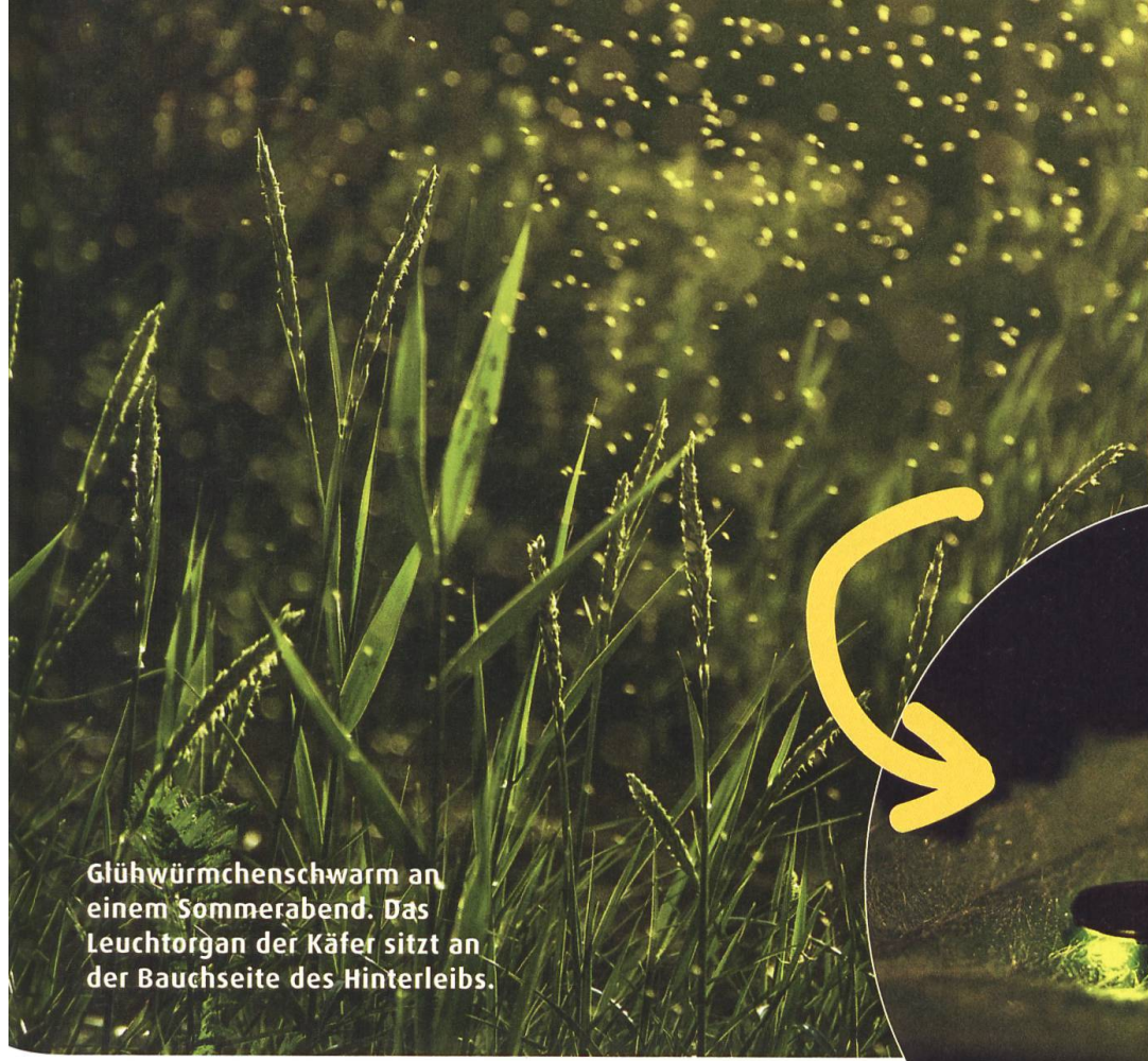
Glühwürmchenschwarm an einem Sommerabend. Das Leuchtorgan der Käfer sitzt an der Bauchseite des Hinterleibs.