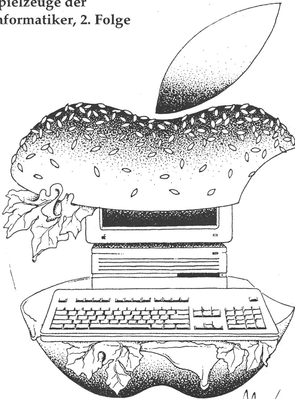
The Big Mac