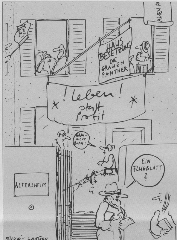
Lebensqualität statt Konsumquantität. Wohngemeinschaften sind auch für alte Menschen eine gute Alternative, lassen sich aber nicht (aus Kostengründen!) verordnen. (Cartoon: Heinz Pfister)