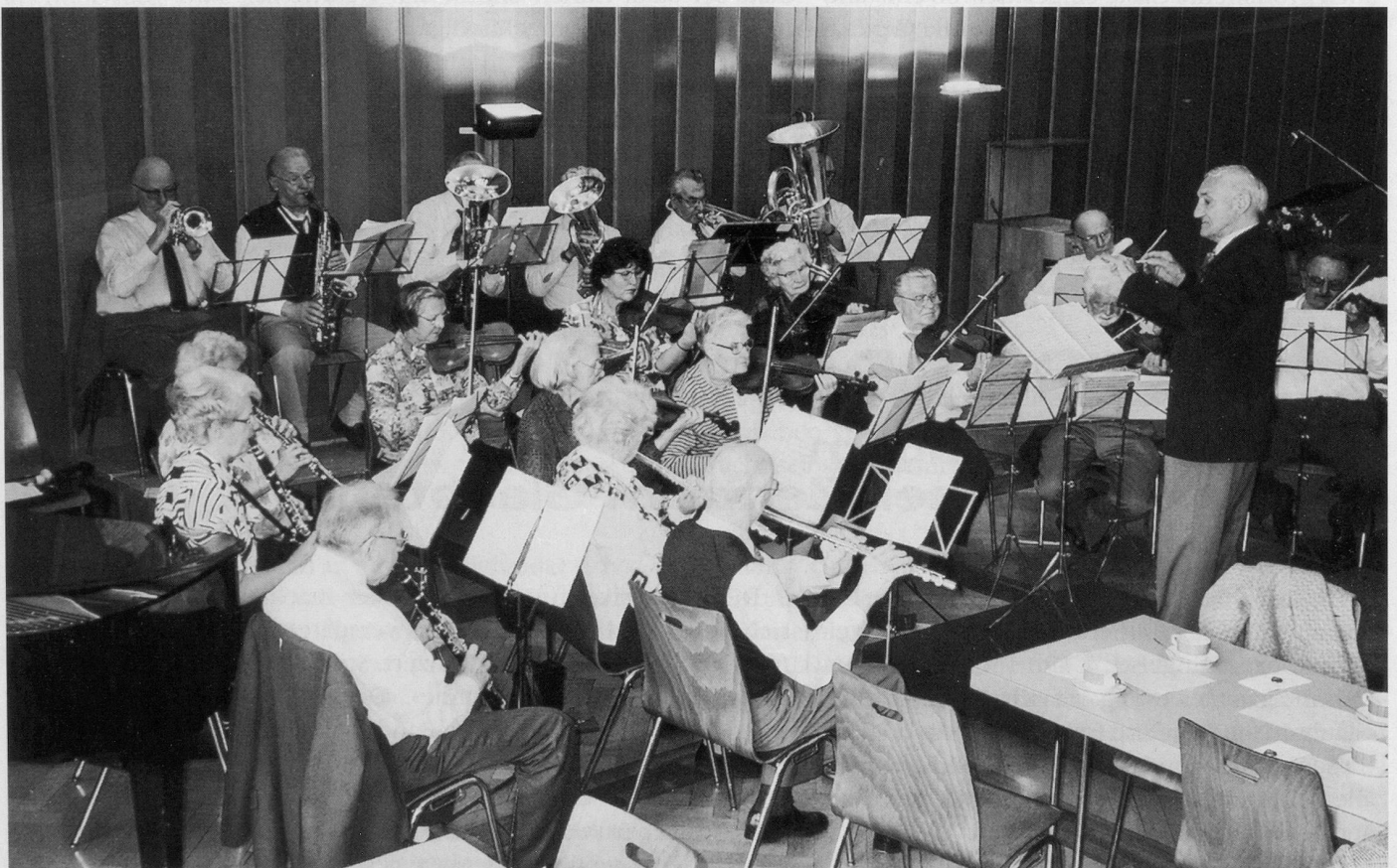
Cello, Piano, Querflöte, Oboe, 2 Klarinetten, 7 Bläser, 9 Violinen: das Senioren-Orchester Zürich