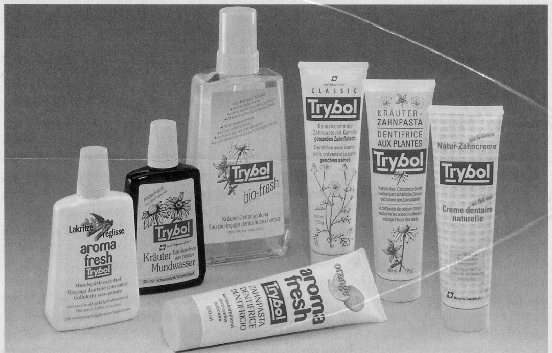
Das Trybol-Mundpflegesortiment: Eine breite Palette von verschiedenen, natürlichen Produkten.

Die Trybol Mundpflegeprodukte wie das Original Trybol-Kräuter Mundwasser