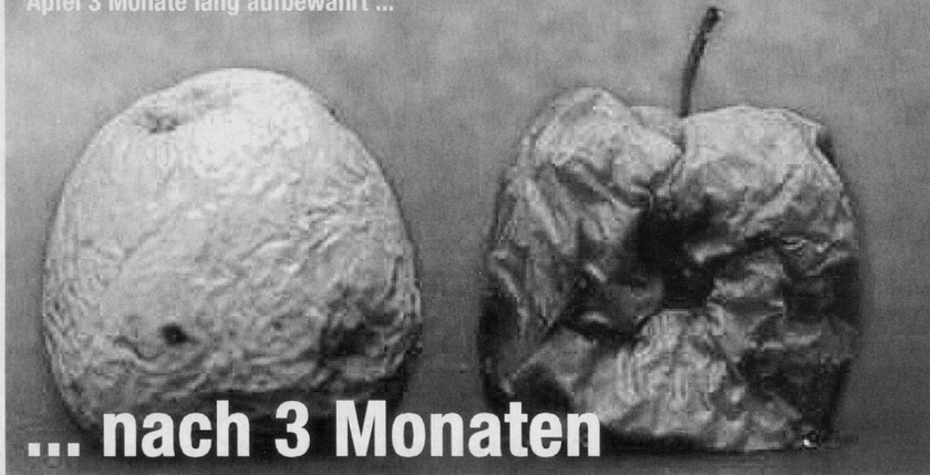
Der linke Apfel wurde nur mit ionisiertem Korallen-Wasser besprüht, der rechte Apfel wurde nicht besprüht und anschliessend wurden beide Äpfel 3 Monate lang aufbewahrt ...

Sango-Korallen bildeten einst die Insel Okinawa. Regenwasser sickert durch diesen prähistorischen, versteinerten Korallenberg und wäscht dabei Mineralien und andere Elemente heraus. Dieses Wasser ist wirklich einmalig. Es beinhaltet nicht nur viele lebenswichtige Mineralien, sondern einen grossen, weltweit einzigartigen Teil an ionischem organischem Kalzium .