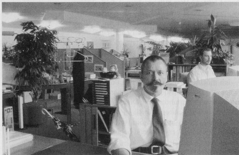
Frühpensionierung bedingt eine persönliche Neuorientierung.

Die Kurse «Meine (Früh-)Pensionierung in Sicht» von Pro Senectute Kanton Zürich bieten die Gelegenheit, den Übergang vom Berufsleben ins Pensionsalter bewusster zu gestalten. Neben