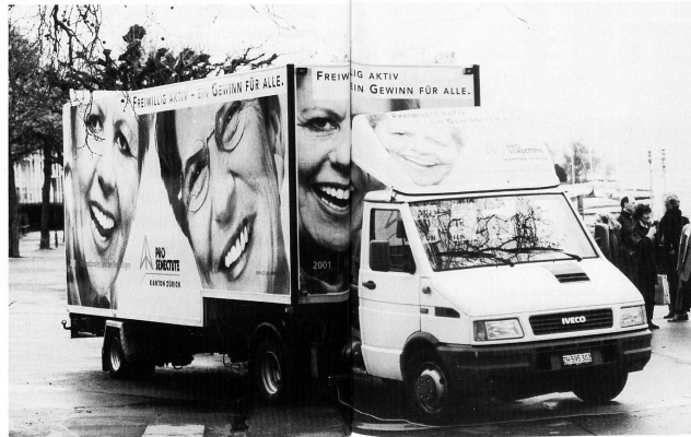
Mit dem Freiwilligen-Mobil stellt Pro Senectute Kanton Zürich während acht Monaten ehrenamtliche Arbeit in den Vordergrund.

Öffentlichkeit, Politik und Wirtschaft sollen sensibilisiert werden für ehrenamtliches Schaffen, welches täglich stattfindet. Heute sind für Pro Senectute Kanton Zürich mehr als 2000 Personen freiwillig im Einsatz. Freiwilligenarbeit ist wie Wasser: unscheinbar, selbstver-