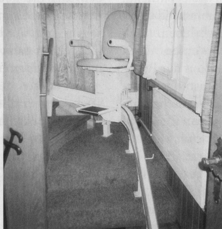
Der Einbau eines Treppenliftes oder ...

Leider ist es noch immer so, dass beim Bau von Wohnungen nicht oder zu wenig an die Bedürfnisse von behinderten und älteren Menschen gedacht wird. Oft muss man bei genauerem Hinschauen feststellen, dass das Hauptproblem nicht bei der behinderten Person, sondern der behindernden Wohnumgebung liegt. Aufzüge, die jeweils nur auf den Zwischengeschossen anhalten, zu schmale Türen, die den Zugang zum eigentlich genügend grossen Badezimmer mit dem Rollstuhl verwehren, und Stufen vor dem Hausingang sind typische Beispiele für dieses Phänomen. Da nützt es dann auch nichts, wenn die Wohnung als solche altersgerecht wäre. Hier ist noch viel Aufklärungsarbeit zu leisten. Und dabei kann und muss nicht «nur» an die soziale Verantwortung von Hausbesitzern und Liegenschaftsverwaltungen appelliert werden. Menschen über 65 machen einen immer grösseren Anteil unserer Bevölkerung aus; ein wachsendes Kundensegment, das nicht vernachlässigt werden sollte. Im