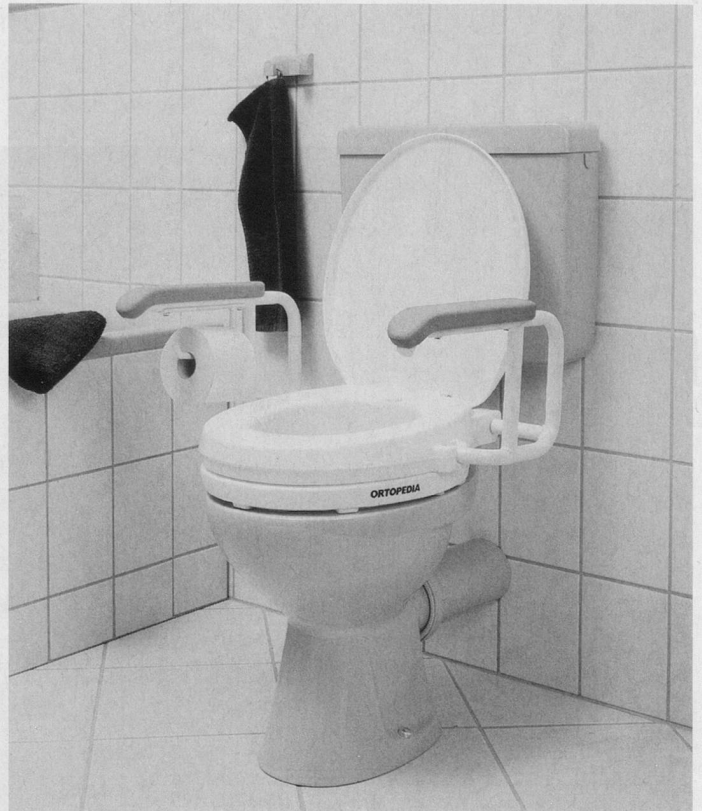
Haltegriffe im Bad, bei der Toilette, erhöhte Sitzflächen für mehr Sicherheit im Alltag.

Manchmal ist es sinnvoll und nötig, die Wohnsituation durch eine bauliche Anpassung den veränderten Bedürfnissen des älteren Menschen anzupassen. Die häufigste Massnahme ist dabei das Anbringen von Haltegriffen bei Badewanne und WC. Manchmal ist es aber auch nötig, einen Treppenlift zu installieren oder die Badewanne durch eine Dusche zu ersetzen (vgl. dazu ALTER&zukunft 3/99). Mieterinnen und Mieter müssen vor dem Planen einer baulichen Mass-