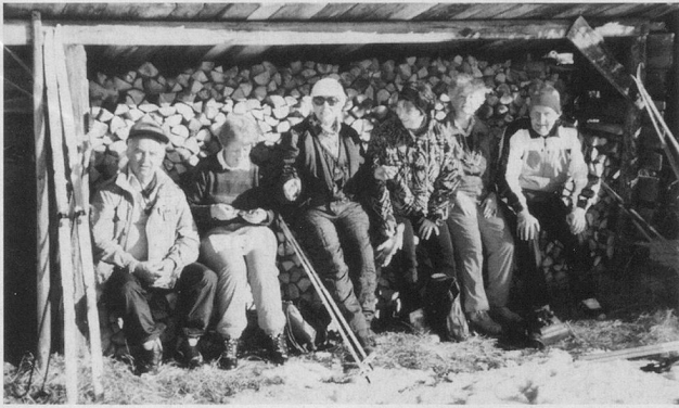
Auch Ruhe und Entspannung gehören zum Langlaufsport.

Der erste eigentliche Ferientag begann trüb, mit leichtem Schneefall, aber schon gegen Mittag zeigte uns eine strahlende Sonne die Gegend in ihrer winterlichen Pracht. So sollte das Wetter die ganze Woche bleiben, abwechslungsreich, mit einigen Kapriolen, aber doch mit viel Sonnenschein und Wärme. Nach der Einteilung in vier Gruppen begaben sich die einzelnen Klassen ins Olympia-