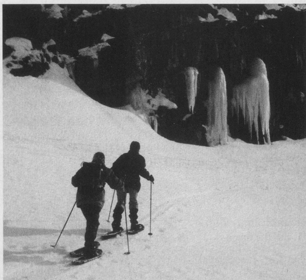
Schritt für Schritt durch die schnee-verzauberte Landschaft – auf Schneeschuhen lässt es sich träumen.