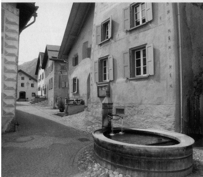
... und dem Dorfbrunnen.