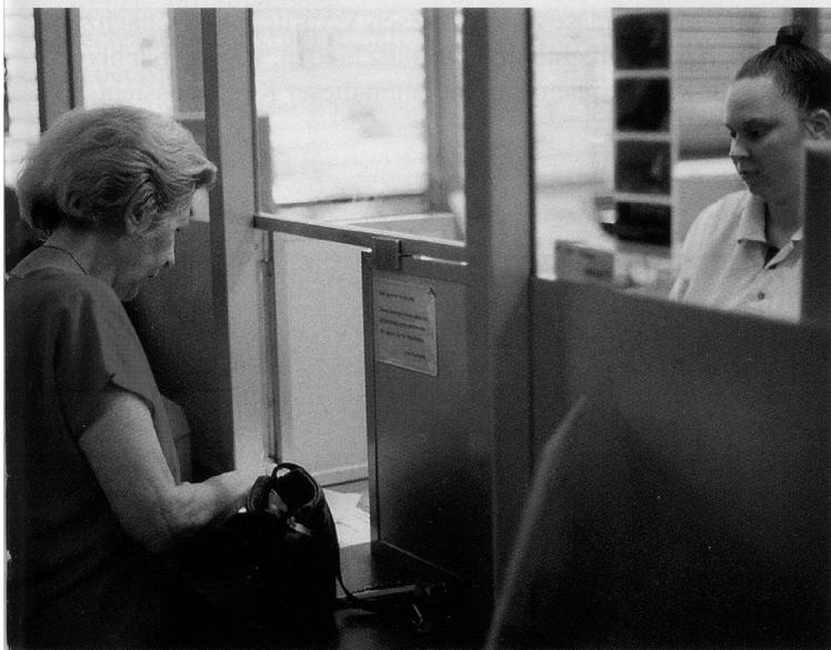
Auch die Post achtet auf rationelle Abläufe.

Eines lässt sich aus den Ergebnissen der Untersuchung deutlich ablesen: Die Diskussion um Rationierung im Gesundheitswesen muss geführt werden, und zwar jetzt und offen, sonst schleichen sich Leistungseinschränkungen durch die Hintertüre ein.