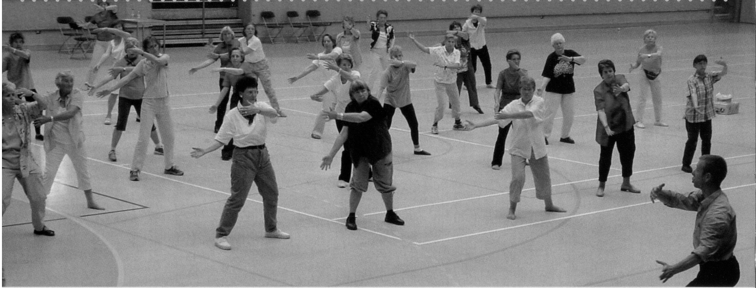
In Schnupperlektionen konnten Interessierte verschiedene Sportarten direkt ausprobieren.

einsamung alter Menschen. Gruppen und Kurse sind Orte der Begegnung. Es werden automatisch neue soziale Kontakte geknüpft. Freundschaften entstehen, soziale Bindungen wachsen. So kann sich jeder bis ins hohe Alter ein Fundament für Gesundheit und Wohlbefinden legen, nicht nur körperlich, sondern auch seelisch, geistig und sozial. Ganz nach dem Credo des Seniorensports «Bewegen – Begegnen – Begreifen – Behalten», wird der bewegungskulturelle Lebensstil, welcher sich bei den Senioren von heute etabliert hat, gefördert.