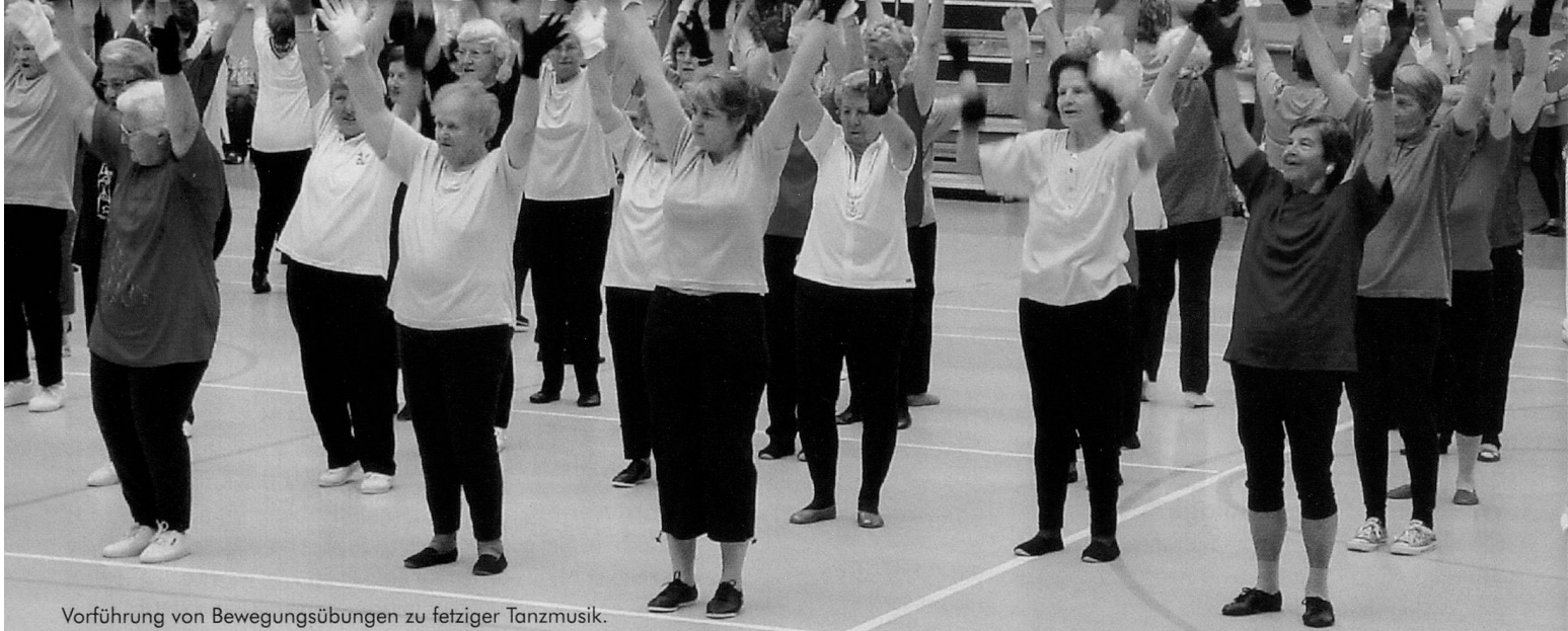
Vorführung von Bewegungsübungen zu fetziger Tanzmusik.