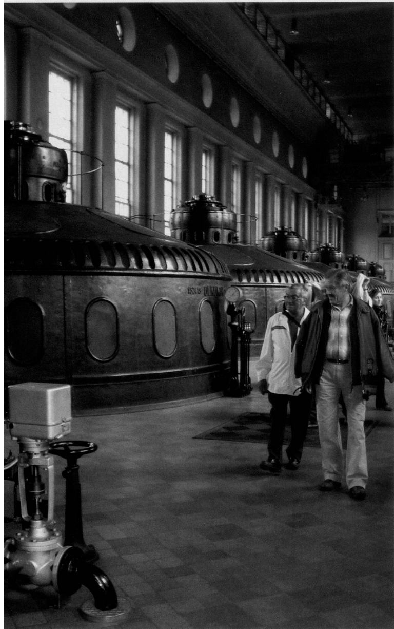
Imposante Turbinen im Kraftwerk Eglisau