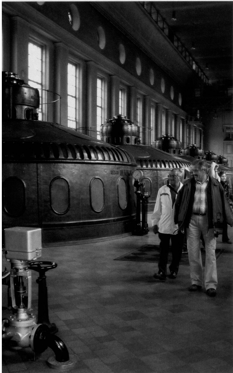
Imposante Turbinen im Kraftwerk Eglisau