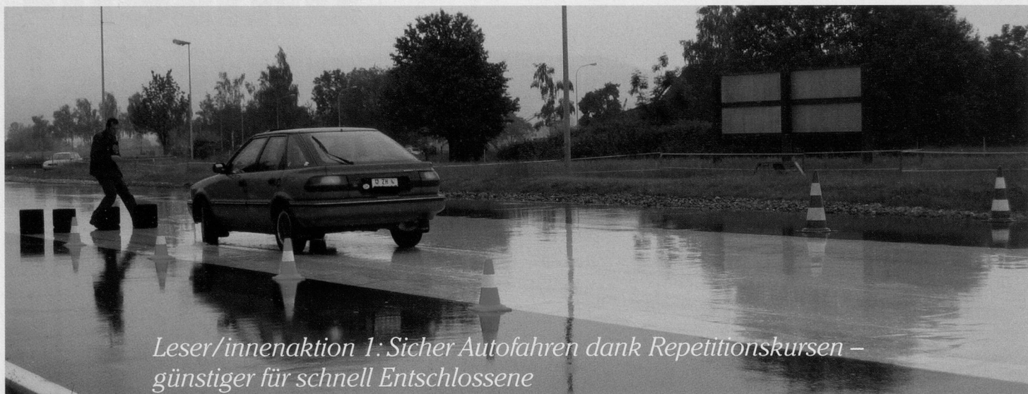
Leser/innenaktion 1: Sicher Autofahren dank Repetitionskursen – günstiger für schnell Entschlossene

Auf der Piste der Antischleuderschule Regensdorf (ASSR) lernen die Kursteilnehmerinnen und -teilnehmer, wie man in heiklen Situationen richtig bremst.