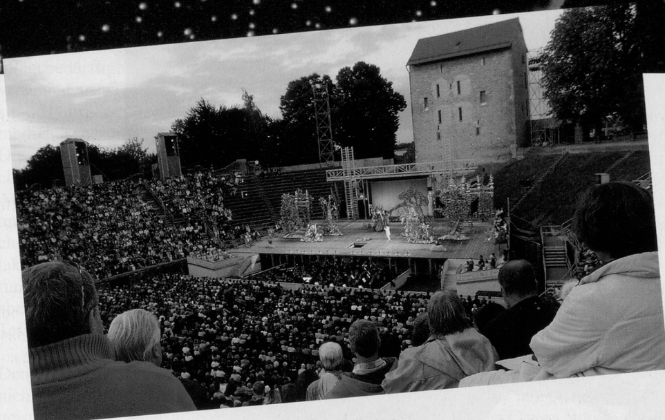
Die Arena in Avenches bietet einen würdigen Rahmen zu Bizets «Carmen».