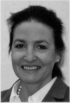
Liebe Leserin, lieber Leser

Ich freue mich, mit dieser Ausgabe des «visit» zum ersten Mal als Geschäftsleiterin der Pro Senectute Kanton Zürich mit Ihnen in Kontakt treten zu dürfen. Am 1. November habe ich meine neue Funktion angetreten und bin beeindruckt von der Vielseitigkeit dieser Organisation. Einen kleinen Ausschnitt unserer Aktivitäten finden Sie auch in dieser Ausgabe des «visit»: von ganz konkreten Dienstleistungen wie dem Treuhand- oder dem Coiffeur-