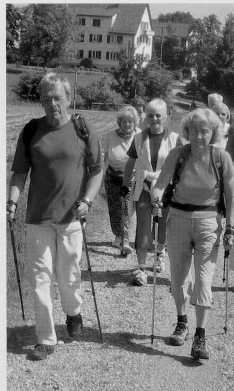
«Lächeln statt Hecheln» ist das Motto beim Nordic Walking.

Wer sich ein Herz und zwei Nordic-Walking-Stöcke fasst und sich auf den Weg macht, erlebt schnell einmal die Vorzüge am eigenen Leib und wird bald daran Gefallen finden. Gestützt werden diese subjektiven Eindrücke von wissenschaftlichen Studien, die erstaunliche Ergebnisse hervorbrachten: Trotz höherem Energieaufwand und grösserem Sauerstoffverbrauch wird Nordic Walking nicht als anstrengend empfunden. Regelmässiges Nordic-Walking-Training trägt zur Gewichtsreduktion bei, fördert